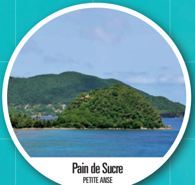
Pain de Sucre PETITE ANSE