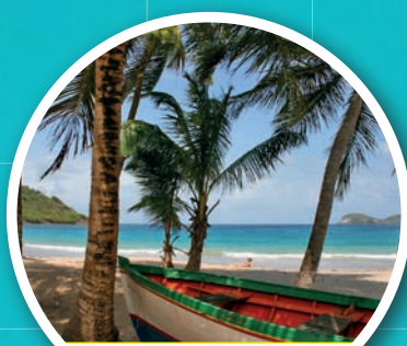
Plage de Grande Anse GRANDE ANSE