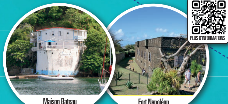
Maison Bateau ANSE DU BOURG

Les Saintes font partie de l'archipel de la Guadeloupe et ont été découvertes par Christophe Colomb en 1493. Parsemés de jolies maisons créoles colorées et de petites plages intimistes, cette baie inspire calme et sérénité. De multiples points de vue sur la baie, tous plus beaux les uns que les autres, vous permettront d'admirer de magnifiques panoramas.