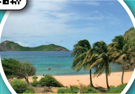
Anse Rodrigue MORNE À CRAÏE