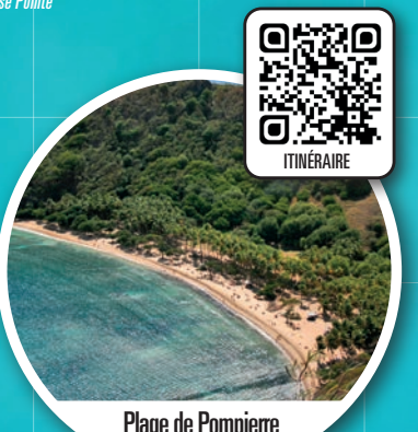
Plage de Pompierre BAIE DE POMPIERRE