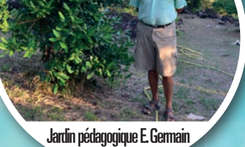
Jardin pédagogique E. Germain BISAU