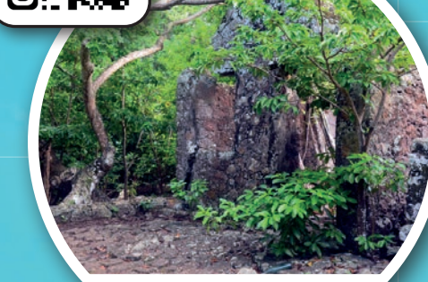
Randonnées Pédestres TERRE-DE-BAS